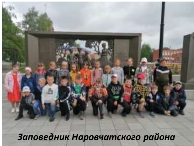
Заповедник Наровчатского района

«Многообразное культурное наследие, сохраненное в Пензе..., делает ее важнейшим центром культуры Российской провинции»