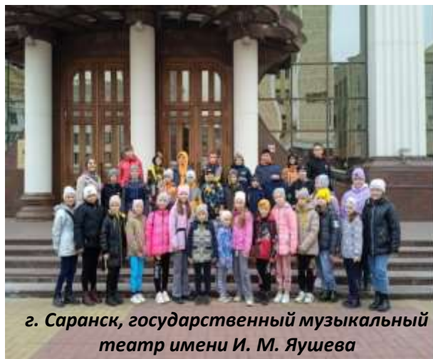
г. Саранск, государственный музыкальный театр имени И. М. Яушева