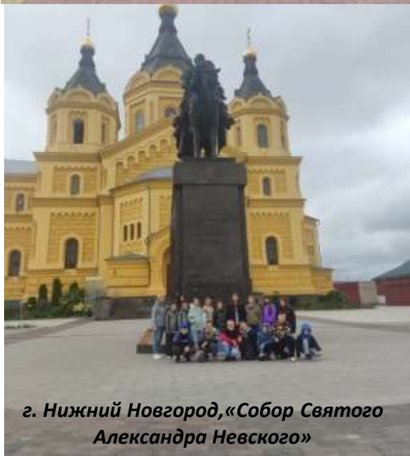
г. Нижний Новгород, «Собор Святого Александра Невского»