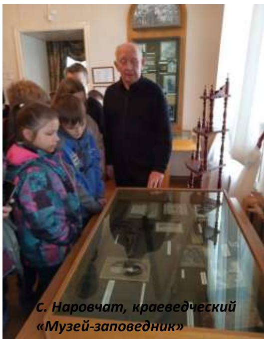
С. Наровчат, краеведческий «Музей-заповедник»