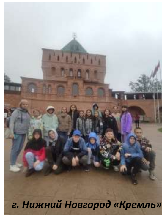
г. Нижний Новгород «Кремль»