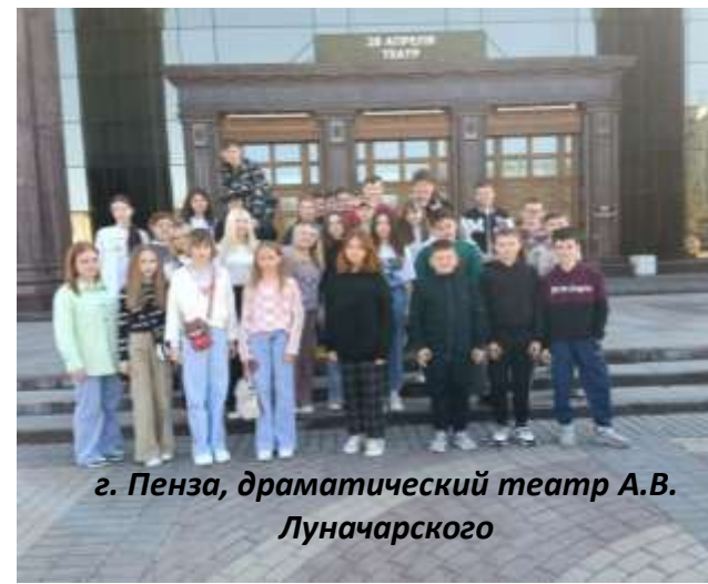
г. Пенза, драматический театр А.В. Луначарского